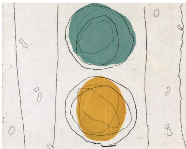
Рис. 1. Тань Пин, «Без названия», гравюра на дереве, 30 см × 40 см, 2015 г.

западный эстетический опыт, формируя самобытные творческие методики. Например, в серии «Без названия» (рис. 1) Тань Пина используются тонко нанесенные фоны и нерегулярные круги для выражения абстрактного языка, обладающего как символическими, так и лирическими качествами; в серии «Юань Су» (кит. «元速») (рис. 2) Мэн Лудина следы сознательного действия растворяются посредством механического рисунка, превращая живопись в символ концепций. Эти практики не только способствовали локализации абстрактного искусства, но и предоставили ценные творческие концепции и методические ресурсы для преподавания абстрактного искусства в университетах [2].