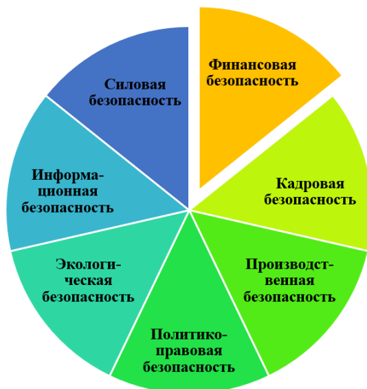
Рис. 1. Составляющие системы экономической безопасности хозяйствующего субъекта

ну деятельности и состояния экономической безопасности субъекта. Исходя из этого можно выделить следующие элементы, представленные на рисунке 1.