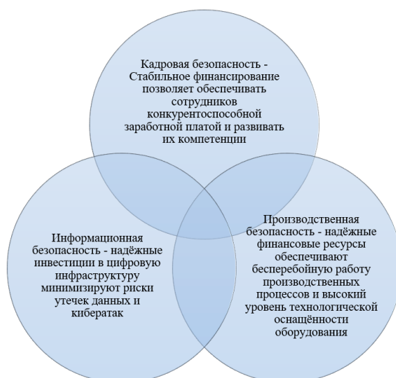
Рис. 2. Влияние финансовой безопасности на другие составляющие системы экономической безопасности субъекта

В общей системе экономической безопасности все составляющие взаимосвязаны, однако их не следует рассматривать в отрыве от финансовой, поскольку она влияет и на другие составляющие. Характеристика этого влияния представлена на рисунке 2.