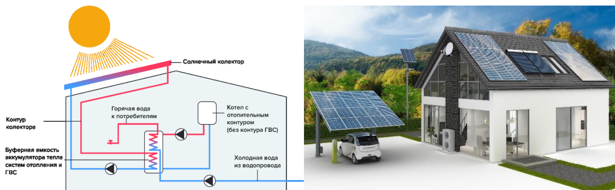
Рис. 1. Схема связи солнечной панели с отопительными системами

1.3. Снижение зависимости от ископаемых видов топлива за счет использования вышеперечисленных систем в конструктиве здания, позволяющих частично или полностью отказаться от привычных нам способов получения энергии.