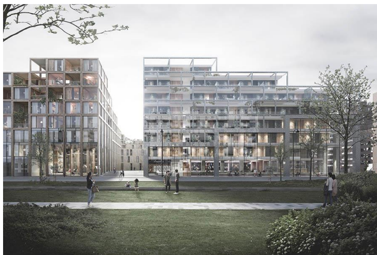
Рис. 5 UN17 Village. Швеция. Архитектурное бюро Lendager Group

Отличным примером не только одного здания, а, даже, комплексной застройки можно смело назвать эко-деревню UN17 Village (рис. 5). Это амбициозный архитектурный проект, который был представлен датской компанией Lendager Group совместно с Älmhult Municipality в Швеции. Основная цель проекта заключается в создании устойчивого жилого комплекса, полностью соответствующего всем 17 целям устойчивого развития ООН (SDG). Отсюда и название UN17 Village.