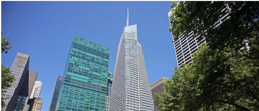
Рис. 3. Bank of America Tower. Нью-Йорк. Архитектор – Ричард Кук

- эффективная система вентиляции, обеспечивающая свежий воздух в помещениях.