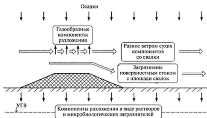
Рис. 1. Схема загрязнения окружающей среды свалками

Свалки представляют собой источники распространения загрязняющих веществ, воздействующих на все компоненты природной среды: атмосферу, гидросферу, литосферу, почву, биосферу. На рисунке 1 показана принципиальная схема загрязнения окружающей среды свалками [1].