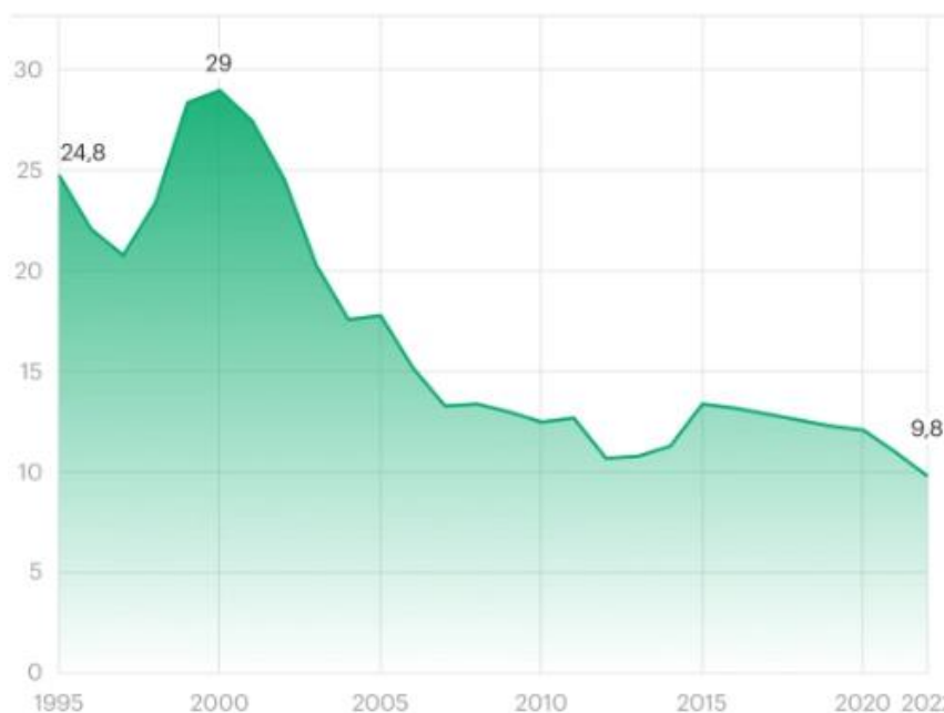
Рис. 2. Доля населения с доходами ниже прожиточного минимума / границы бедности, %

Согласно данным Росстата, происходит снижение доли населения, которое находится за чертой бедности. Обратимся к рисунку 2.