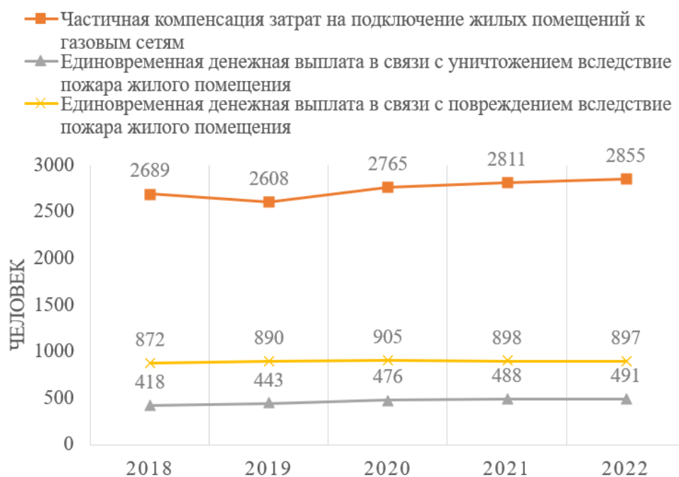
Рис. 3. Количество получателей социальной помощи в Свердловской области [16] Финансирование деятельности Министерства за последние 5 лет наращивается, что говорит об увеличении возможностей оказания социальной помощи (рис. 4).