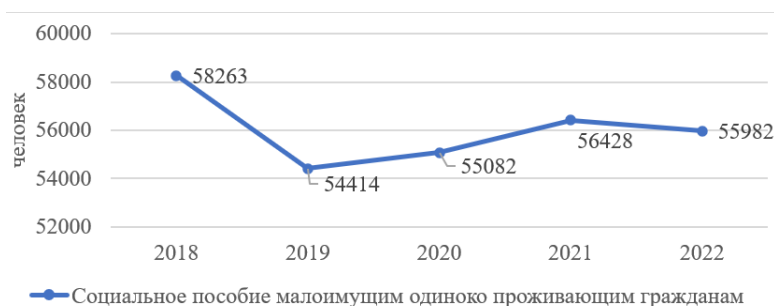
Рис. 2. Количество малоимущих одиноко проживающих граждан в Свердловской области, получающих социальное пособие [16]

ствует о необходимости проведения дальнейших мероприятий.