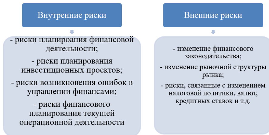
Рис. 2. Внутренние и внешние риски организации

В основном в финансовом планировании выделяются риски, связанные с недополучением финансовых результатов. Риски подразделяются на внутренние и внешние (рис. 2) [3].