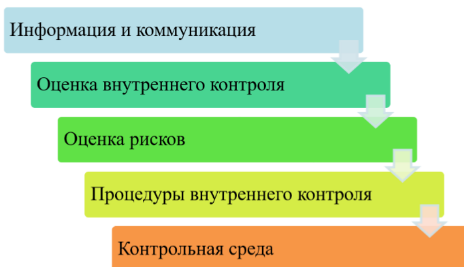
Рис. 1. Элементы системы внутреннего контроля организации [3]

Процедуры внутреннего контроля, установленные в организации, раскрывают специфику его осуществления. Необходимость их проведения подтверждается тем, что по выявленным отклонениям можно установить наличие рисков экономической безопасности организации. При этом особую значимость имеют процедуры компьютерного контроля из-за широкого использования компьютерных технологий с защитой информационных активов от утечки и несанкционированного к ним доступа [4, с. 151]. Процедуры определяют контроль как процесс, основным методом которого является оценка рисков, как вероятности потери экономической стабильности. По результатам проведения кон-