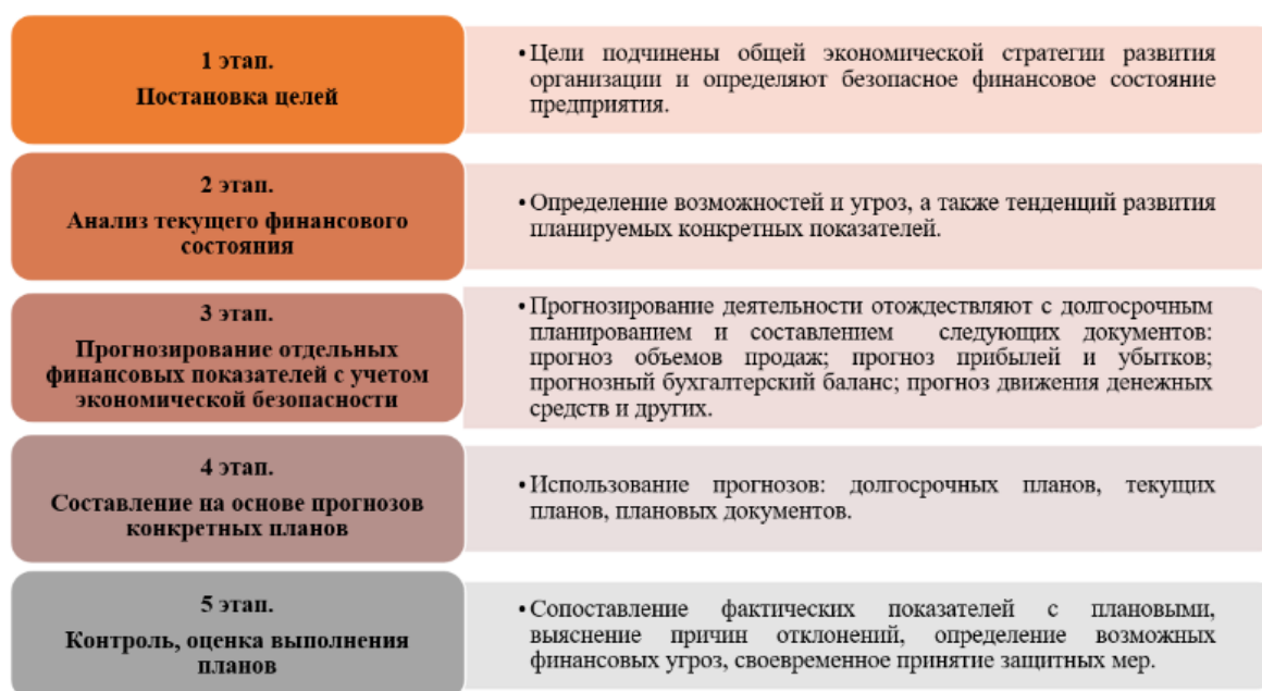
Рис. 1. Этапы составления финансового плана

План объединяет расчеты, положения и мероприятия по его реализации. На этапе контроля используются как ориентиры пороговые значения индикаторов – показателей. Экономическая эффективность плана характеризуется системой показателей, основным показателем которого является прибыль.