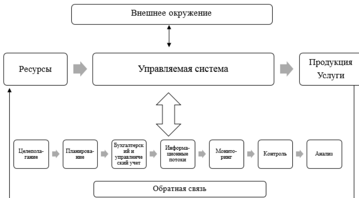
Рис. 3. Модель системы экономической безопасности организации

В формировании и функционировании системы экономической безопасности главная роль принадлежит руководству организации. Оно должно установить принципы, процедуры и возложить основные функции по их реализации на конкретных сотрудников.