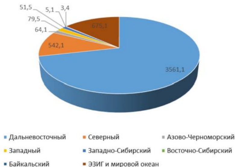
Рис. 3. Объемы вылова рыбной продукции по федеральным округам РФ, 2021 г., тыс. тонн. [11]

Подводя итог анализа статистических данных, отметим достаточно большой потенциал рыбного хозяйства в Российской Федерации. При этом рыбное хозяйство в Российской Федерации имеет свои особенности размещения, специализации, кооперирования и интеграции.