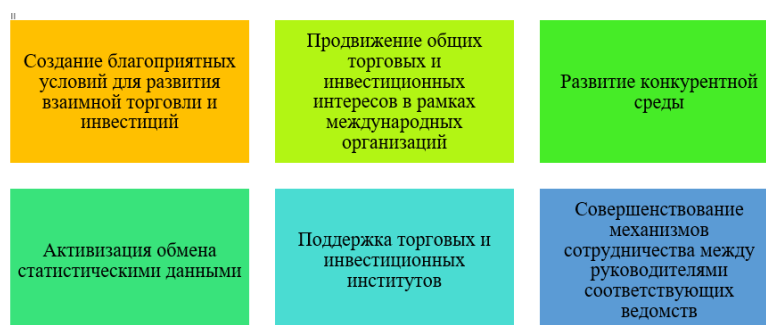
Рис. 2. Ключевые цели торгово-экономического сотрудничества России с партнерами по БРИКС

Исходя из данной Концепции можно выделить ключевые цели торгово-экономического сотрудничества России с другими государствами-участниками БРИКС.