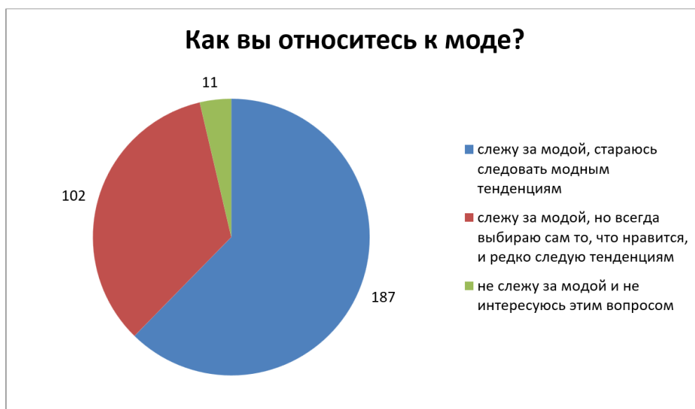
Рис. 1. Отношение респондентов к моде

На вопрос «Насколько важна мода в молодежной среде» 256 респондентов дали ответ «мода очень важна для молодежи», 44 – «мода вероятно важна в молодежной среде» и 0 – «мода для молодежи совершенно не важна».