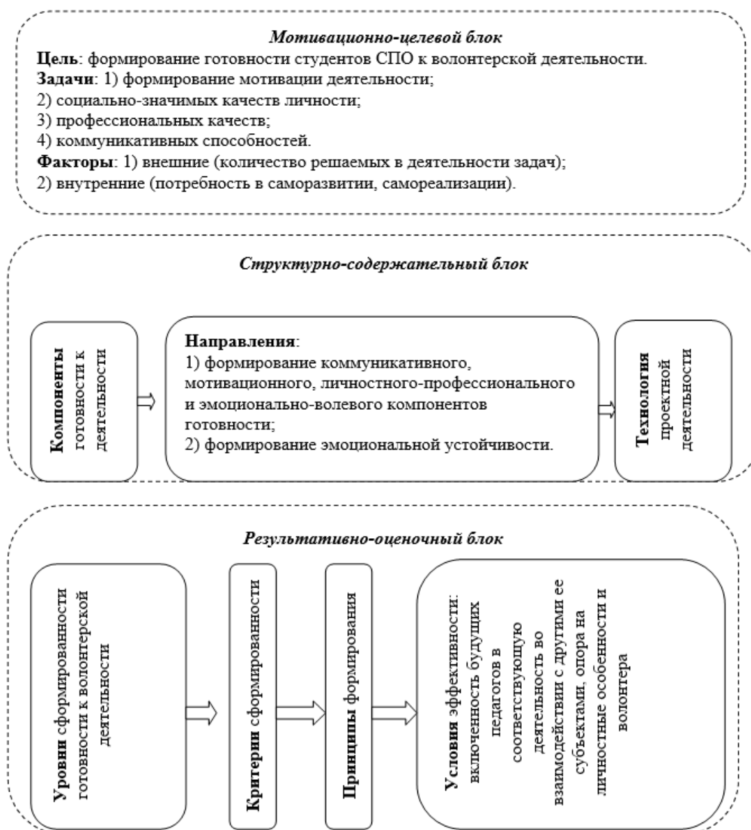
Рис. 1. Модель формирования готовности студентов СПО к волонтерской деятельности

В ходе мероприятий по введению авторской Модели было разработано содержание в рамках основного направления реализации проектной деятельности студентов СПО - экологического волонтерства, включающего в себя деятельность по охране природы, повышению информационной осведомленности, как субъектов, так и населения путем организации тематических встреч, семинаров, практик в рамках тем по экологии.