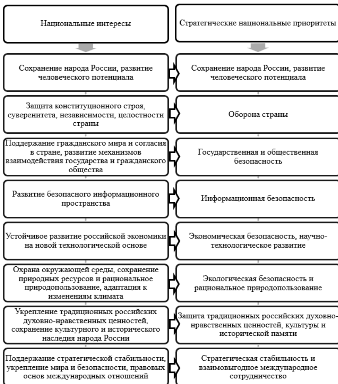
Рис. 2. Национальные интересы и стратегические приоритеты РФ

Для обеспечения национальной безопасности России необходимо соблюдение ее интересов и приоритетов в этом направлении, что представлено данными рисунка 2.