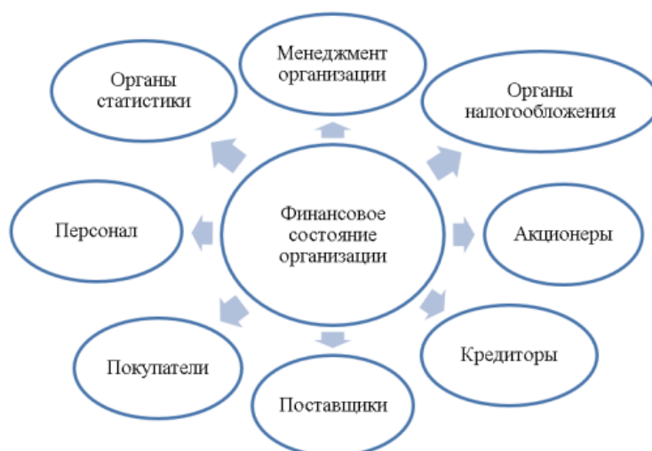
Рис. 1. Субъекты анализа финансового состояния организации

Рисунок 1 показывает состав участников, заинтересованных в финансовом состоянии предприятия. Эти лица формируют свое представление о финансовом состоянии путем целенаправленного использования источников первичной и вторичной информации. Финансовый анализ служит основой для подобных процедур. Анализ финансового состояния предприятия – это тщательный процесс применения методов и методов анализа к информационной выборке, состоящей из показателей финансового состояния, чтобы сделать выводы о конкретных параметрах развития организации.