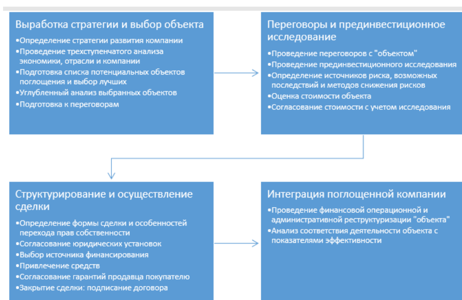
Рис. 2. Алгоритм сделки слияния и поглощения на мировом рынке развитых стран

На рисунке 2 представлен алгоритм слияния и поглощения организаций на мировом рынке развитых стран.