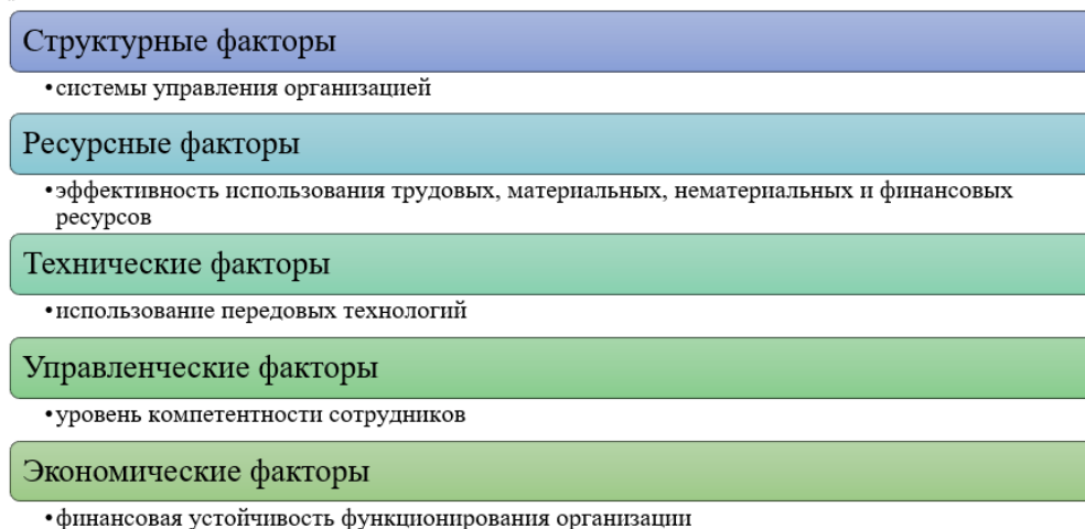
Рис. 1. Внутренние факторы конкурентоспособности организации

критерий эффективного управления организацией и успешности на рынке в условиях нестабильности внешней среды, поскольку зависит от внутренних факторов, которыми можно управлять (рис. 1).