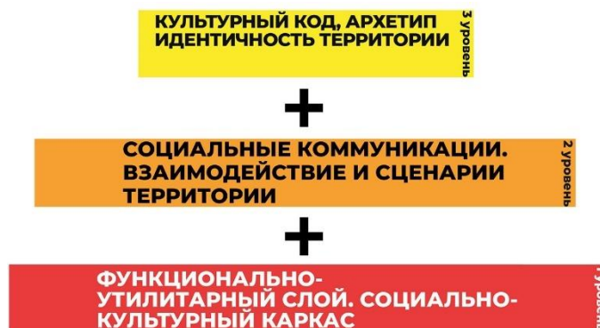
Рис. 3. Авторский подход к определению понятия «социокультурное пространство» в градостроительстве (трёхуровневая структура)

ванный в открытые (общественные, рекреационные) пешеходные пространства городской среды с различными видами социальных коммуникаций населения на данных территориях и сценариями их использования, составляющие в представлении (восприятии) жителей определённые архетипы (со своей идентичностью, культурным кодом) (рис. 3).