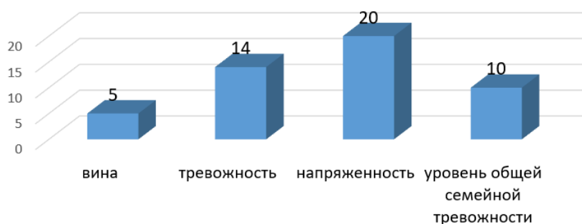
Рис. 3. Распределение родителей в зависимости от испытываемых чувств и состояний, а также уровня общей семейной тревожности представлено в процентном отношении

нимание; в 86% семей выявлены адекватные формы взаимодействия с детьми, а в 14% семей – неадекватные. Здесь можно сделать следующий вывод о том, что в семьях с детьми с ОВЗ, присутствует эмоциональное принятие ребёнка с особенностями, рациональное понимание особенностей его развития и воспитания, что родителям в одиночку с этими проблемами не справиться, а необходимо обращаться к помощи специалистов; и родители умеют адекватно взаимодействовать со своими детьми.