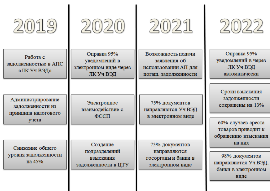
Рис. 1. Ключевые результаты повышения эффективности администрирования взыскания задолженности по уплате таможенных платежей

Немаловажным драйвером расширения использования практики добровольного погашения задолженности по уплате таможенных платежей является применение системы риск-категорирования участников внешнеэкономической деятельности. Наличие задолженности по уплате таможенных пошлин и налогов относится к блокирующим критерием, не позволяющим плательщикам использовать упрощения, предназначенные для участников ВЭД низкого и среднего уровня риска.