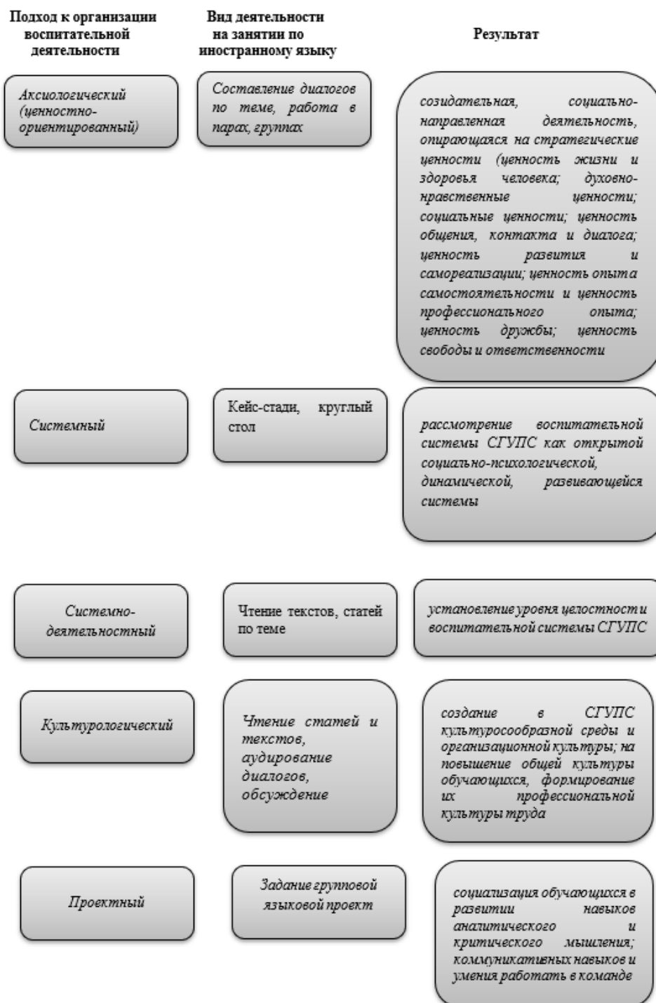
Рис. 2. Реализация методологических подходов к воспитательной деятельности на примере дисциплины «Иностранный язык»

Как видно из рисунка выше, реализация перечисленных методологических подходов воспитательной деятельности находит свое эмпирическое применение при изучении иностранного языка. Стоит также отметить преемственность образовательной и воспитательной деятельности на содержательном уровне [6].