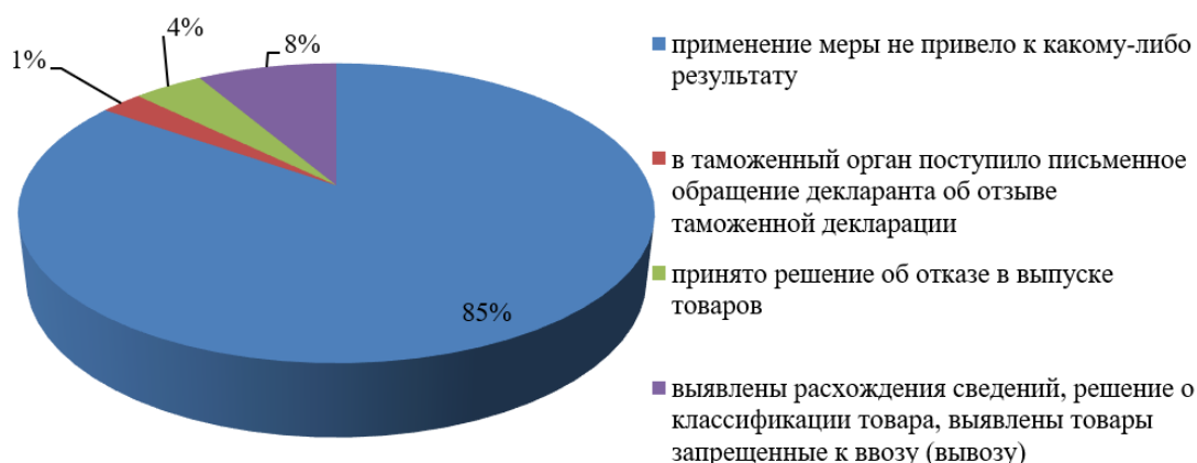
Рис. 1. Результаты применения общероссийских и обязательных к применению профилей рисков в 2019 г.

- контроль соблюдения условий помещения товаров под таможенные процедуры.