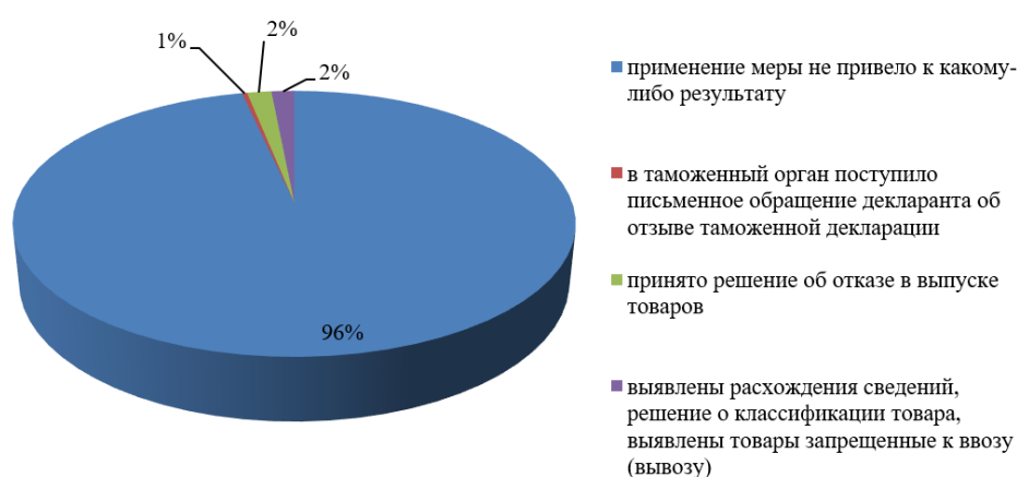
Рис. 2. Результаты применения общероссийских и обязательных к применению профилей рисков в 2020 г.