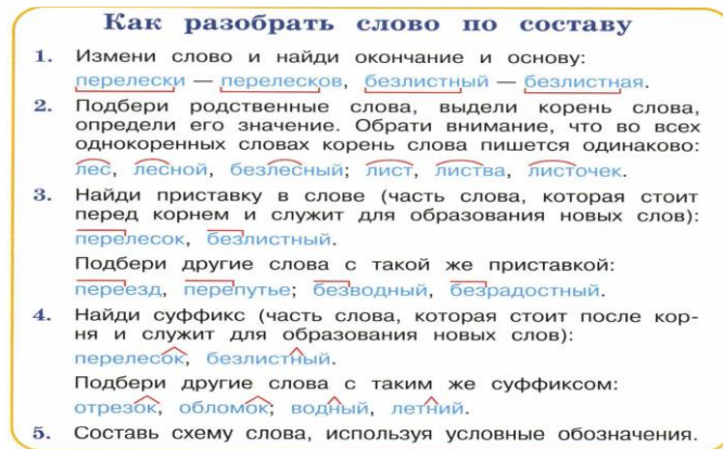
Рис. 2. Русский язык Л.Ф. Климанова, Т.В. Бабушкина, 3 класс, 1 часть [3]

Поворот на решение словообразовательных задач, на организацию собственно словообразовательных наблюдений, безусловно, требует изменения методики обучения морфемному анализу в начальной школе, поскольку существующие рекомендации по проведению данного вида языкового анализа провоцируют учащихся к формальному выделению морфем [1].