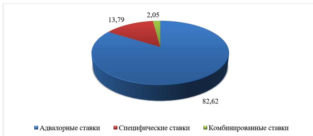
Рис. 1. Удельный вес видов ставок таможенных пошлин в ЕТТ ЕАЭС, % [6]

Союза, но по видам ставок он имеет определенную структуру (рис. 1).