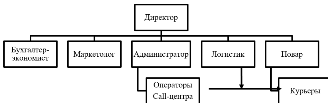
Рис. 2. Модель организационной структуры

механизмом его реализации позволяет предложить следующую модель организационной структуры (рис. 2).