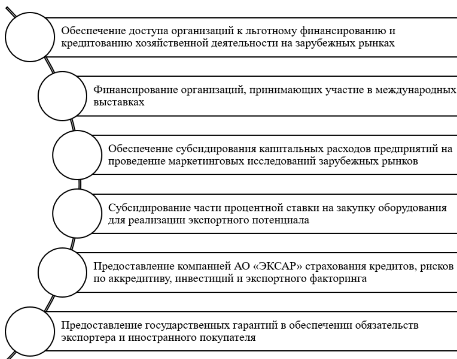
Рис. 3. Основные формы и методы финансовой поддержки экспортной деятельности предприятий России [5]

Рассмотрим характеристику и организационную особенность каждого метода государственной финансовой поддержки экспорта в экономике России.