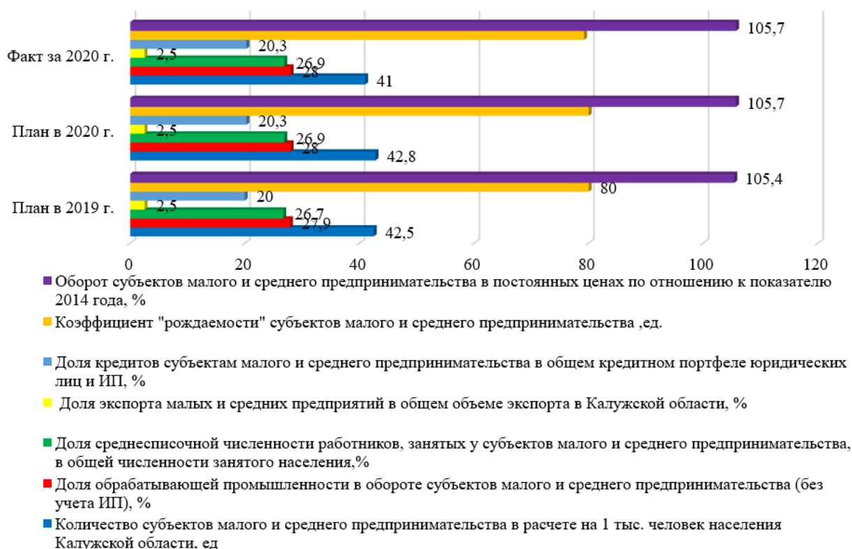
Рис. 2. Основные индикаторы Программы и их значения [2, 6]

Данные, представленные на рисунке 2 свидетельствуют о том, что выполнение государственной программы Калужской области «Развитие предпринимательства и инноваций в Калужской области» в 2020 году характеризуется высоким уровнем эффективности – 99,3%. Этому способствовала реализация дополнительных мер государственной поддержки субъектов МСП. А введение антикризисных мер в 2020 году способствовало сохранению бизнеса субъектов МСП в Калужском регионе.