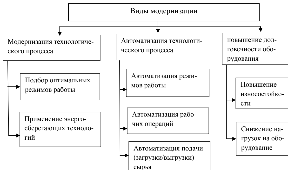
Рис. 2. Виды модернизации предприятия

виды модернизации, способствующие проведению успешной модернизации предприятия (рис. 2).