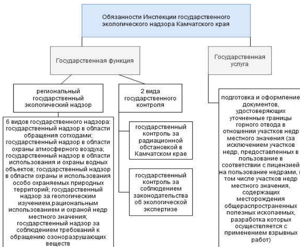
Рис. 1. Обязанности Инспекции государственного экологического надзора Камчатского края [4]

торые на сегодняшний день выполняют сотрудники Инспекции, представлены на рисунке 1.