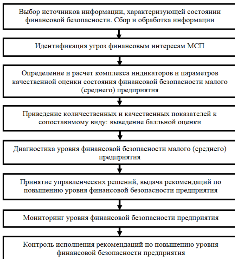
Рис. 3. Этапы методики обеспечения финансовой безопасности предприятий малого и среднего бизнеса

Необходимо отметить, что современные методы анализа и оценки, содержат многообразие проведения оценки уровня работы хозяйствующих субъектов, при выборе которых, необходимо иметь в виду специфику деятельности малого бизнеса. Общие критерии диагностики к субъектам малого предпринимательства должны корректироваться при определенных их значений и границ.