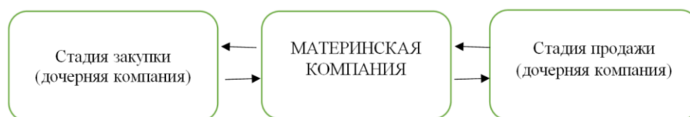
Рис. 1. Схема бизнеса при «вертикальной» интеграции Группы взаимосвязанных компаний

Таким образом, при «очищении» связанных показателей, таких как «счета к получению» в материнской компании и «счета к оплате» – в дочерней, долей в уставном капитале и суммировании дру-