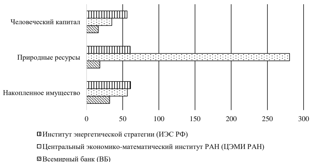
Рис. 1. Анализ структуры НБ РФ за 2018 год (в трлн долл. США)

отличие между оценками отечественных институтов говорит об отсутствии единой системы оценивания качественных и количественных показателей, формирующих совокупное национальное богатство России.