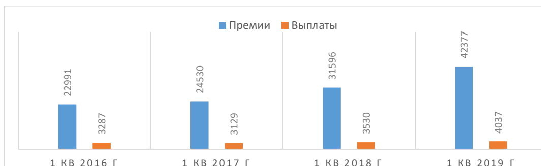
Рис. 2. Динамика страховых премий и выплат по страхованию от несчастных случаев на 1 кварталы 2016-2019 гг. (млн руб.) [3, с. 6]

На рисунке 2 отразим динамику значений страховых премий и выплат по страхованию от несчастных случаев по итогам первых кварталов 2016-2019 гг.