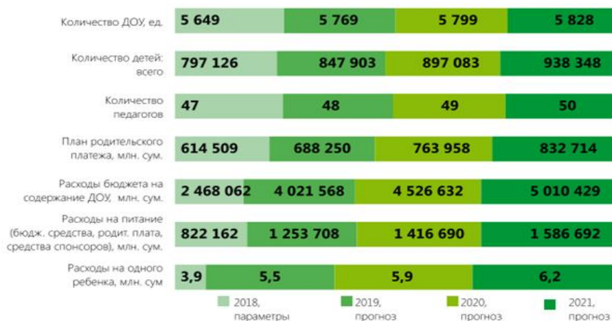
Рис. 2. Увеличение охвата и расходов Государственного бюджета Узбекистана на дошкольные образовательные учреждения [2]

На рисунке 2 показано, что объем средств, выделяемых из бюджета на финансирование дошкольных образовательных учреждений, год от года увеличивается. В 2019 году эта сумма составит 4021568 млрд. сумов, что на 62,9% больше, чем в 2018 году, а к 2021 году планируется направить на эти цели 5010429 млрд. сумов или 112,6% к 2019 году.