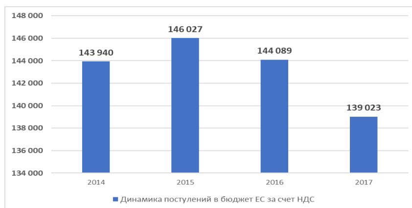
Рис. 2. Динамика поступлений в бюджет ЕС за счет НДС (2014-2017 гг.) млрд. евро [5]

На рис. 2 изображена динамика поступлений в бюджет ЕС за счет НДС. В 2015 году в бюджет поступила наибольшая сумма дохода от НДС – 146027 млрд. евро, а наименьший доход от налога на добавленную стоимость был начислен в 2017 году и составил 139023 млрд. евро. Такая тенденция может быть связана с низким уровнем внешней торговли товарами или с широким использованием пониженных ставок НДС, подлежащих уплате, связанных с какими-либо льготами.