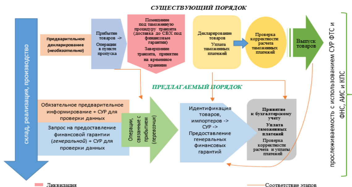
Рис. 1. Основные изменения бизнес-процессов в рамках предлагаемой модели администрирования таможенных платежей в РФ [2]

Основные изменения бизнес-процессов в рамках предлагаемой модели представлены на рисунке 1.