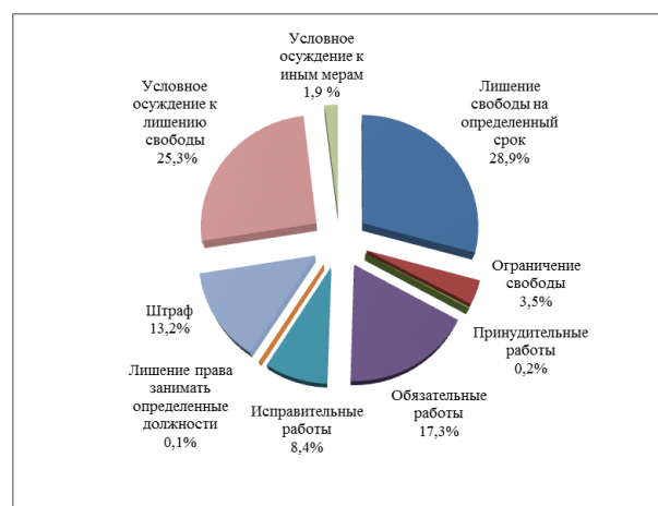
Рис. 2. Применение основных видов наказания в 2018 г. [15]

Рост применения таких наказаний, как обязательные, исправительные или принудительные работы отражает реализацию на практике принципа справедливости, согласно которому наказание за совершенное преступное деяние должно быть сопоставимо с характером и степенью общественной опасности преступления, обстоятельствами его совершения и личностными особенностями виновного [14, с. 46]. В настоящее время удельный вес лиц, осужденных к лишению свободы, составляет 28,9% от общего числа осужденных, удельный вес лиц, к которым применено наказание в виде обязательных работ – 17,3%, исправительных работ – 8,4%, принудительных работ – 0,2% (рис. 2).