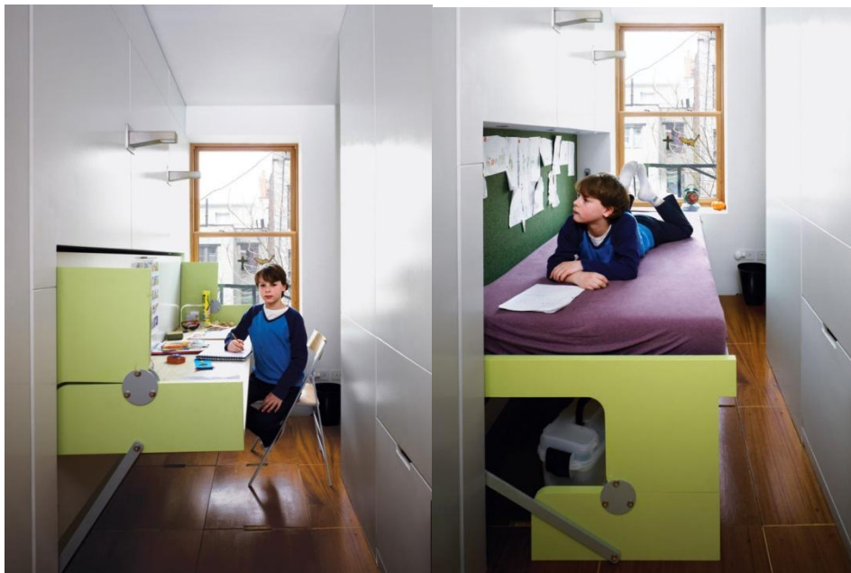
Рис. 3. Кровать-стол в квартире на Манхэттене, спроектированной Скоттом Оливером и Маргаритой МакГрат

является раздвижной диван, который учитывает чёткое разделение дня у человека на часы бодрствования и часы сна. В мировой практике можно встретить и более «сложную» мебель: например, кровать, превращающаяся в широкий рабочий стол (квартира на Манхэттене, спроектированная Скоттом Оливером и Маргаритой МакГрат) (рис. 3) или огромный шкаф-трансформер, объединяющий в себе кладовую, место для хранения кухонных принадлежностей, шкаф, бар, кровать и офис (квартира-офис, спроектированная Майклом Ченом и Кари Андерсоном) (рис. 4) [1].