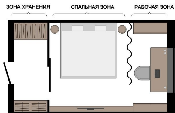
Рис. 1. Планировочное решение комнаты с разделением на три функциональные зоны

шторы и ширмы. Необычным и современным способом разделить пространство в квартире на функциональные зоны являются «трансформирующиеся» перегородки, которые могут складываться, разъезжаться и даже перемещаться по квартире в зависимости от потребности жильцов в том или ином пространстве.