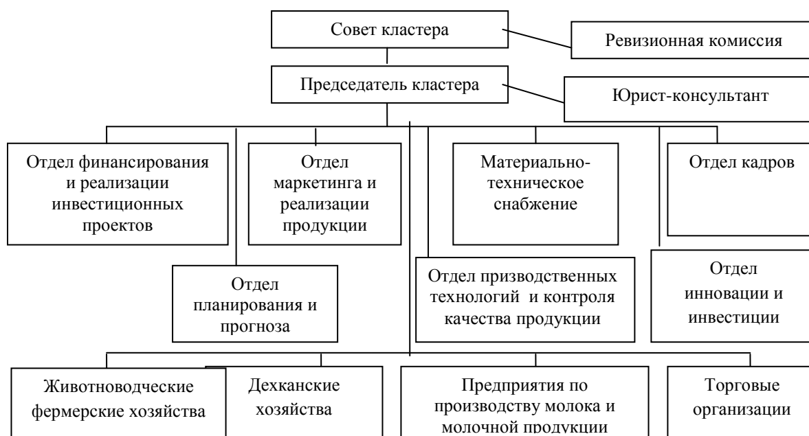
Рис. 2. Примерная структура регионального кластера по производству, переработке и реализации молочной продукции

В целом, создание и развитие новых форм хозяйств, в частности специализированных кластеров по переработке сельхозпродукции, в том числе тех, структура которых предложена выше, послужит дальнейшему развитию производства и переработки сельскохозяйственной про-