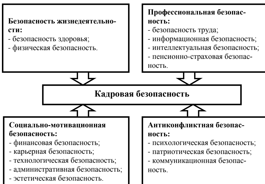
Рис. 1. Составляющие кадровой безопасности

Приведенные определения предоставляют основания утверждать, что кадровая безопасность, будучи элементом экономической безопасности предприятий, при условии, что в нем присутствуют все этапы организации и управления персоналом, направленная на установление таких трудовых и социокультурных отношений, обеспечивающих безубыточную деятельность предприятия. Поэтому, кадровую безопасность предприятия можно исследовать как комбинацию ее составляющих (рисунок 1).