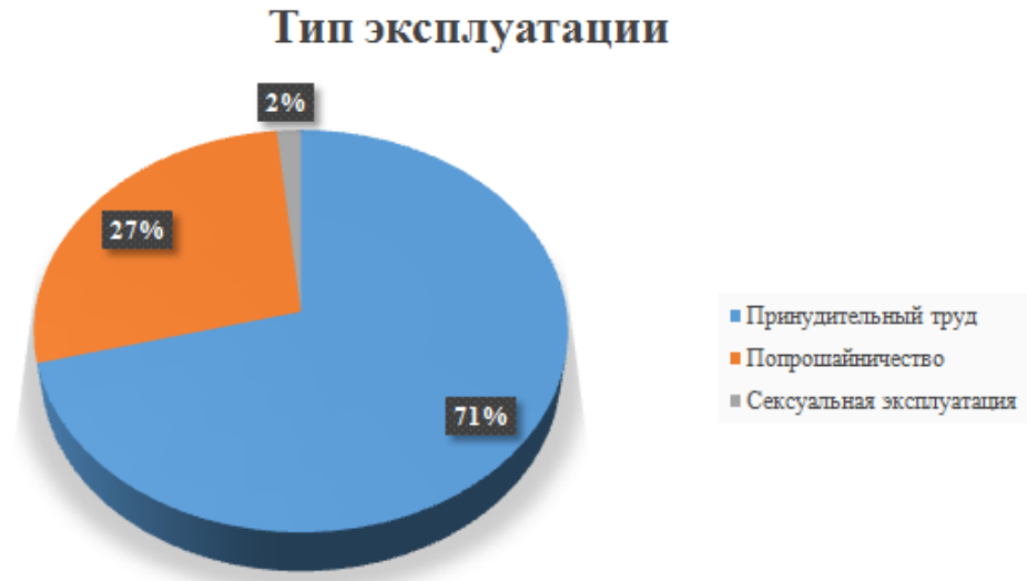
Рис. 2. Причины обращения мигрантов в МОМ в январе-августе 2014 года

Нелегальные мигранты являются очень уязвимой категорией: на них не распространяется правовая защита государства, они зачастую становятся жертвами эксплуатации и принуждения. Очевидно, что нелегальная миграция таит в себе угрозу не только для самих иностранных работников, осуществляющих трудовую деятельность в иностранном государстве на незаконных основаниях, но и для государства в целом, при чем как для страны, поставляющей такую рабочую силу, так и для принимающей ее. Кроме того, нелегальная миграция может попросту негативно сказаться на жизни и состоянии здоровья работника. Поэтому необходимость противодействия, в том числе на международном уровне, нелегальной миграции не вызывает сомнения.